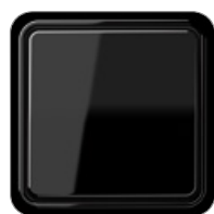
negro similar RAL 9005