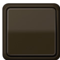
marrón similar RAL 8022