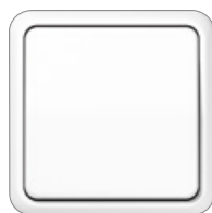
blanco alpino similar RAL 9010