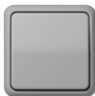
gris similar RAL 7038