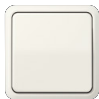
blanco marfil similar RAL 1013