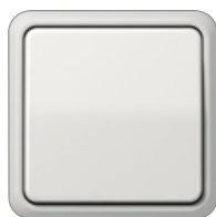
gris claro similar RAL 7035