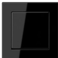
negro similar RAL 9005