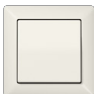
bianco simile RAL 1013

La stampa personalizzata laser o a colori dei prodotti JUNG è possibile usando il Graphic Tool. Il metodo di stampa dipende dal materiale e dal colore. Maggiori informazioni sono disponibili presso www.jung.de/gt .