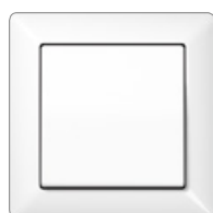
bianco alpino simile RAL 9010