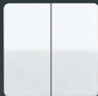
Kurzhubtaste für Universal-Serientastdimmer