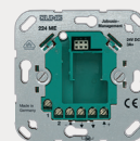
Universal 24 V DC

Für eine 24 V DC Anschlussleistung des Rohrmotors. Über Nebenstelleneingänge sind weitere Jalousiesteuerungen für den Gruppen- und Zentralbetrieb möglich.