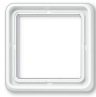
CD 500 bruchsicher