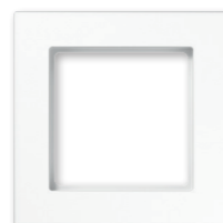
A creation bruchsicher