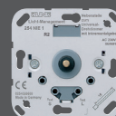
Nebenstelle mit Inkrementalgeber

Dimmen an der Haupt- und Neben- stelle über Drehregler möglich