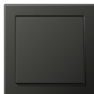
Anthrazit Aluminium lackiert