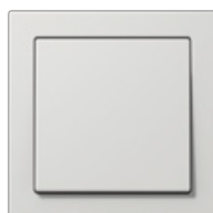
lichtgrau ähnlich RAL 7035