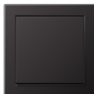
Dark Aluminium lackiert