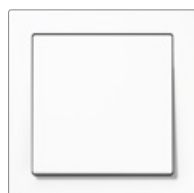
alpinweiß ähnlich RAL 9010