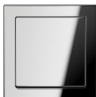
Glanzchrom verchromtes Metall