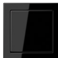
schwarz ähnlich RAL 9005